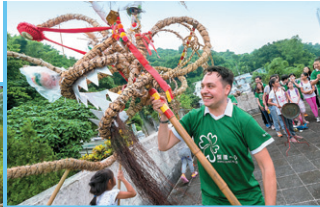
義工帶領小學生認識饒富特色的傳統藝術