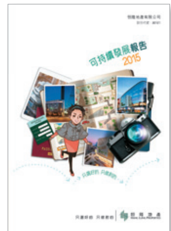
恒隆的《可持續發展報告2015》在「2016亞洲可持續發展報告獎」中榮獲三項殊榮

以渣打銀行大廈為例，我們於過去六年斥資逾港幣3,000萬元，全面提升物業的中央空調系統，並改善室內空氣質素。項目因此獲得香港綠色建築議會頒授「綠建環評（BEAM Plus）1.2版（既有建築）」最終鉑金級認證，成為香港首座獲得此項殊榮的辦公樓。