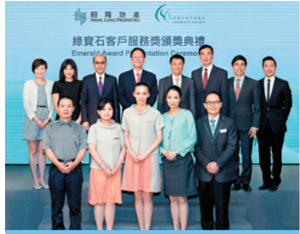
恒隆設立「綠寶石客戶服務獎」，讚揚在客戶服務方面表現出色的前線員工

在香港，義工隊除了延續「建築導賞團」和「孖住長者當文青」系列外，更推出嶄新的「也文也武 文化傳承」系列，帶領一班來自低收入家庭的小學生認識饒富特色的傳統藝術，如活字印刷、竹棚建築、舞火龍及粵劇。去年，我們為超過200位中學生舉辦「建築導賞團」，啟發他們對本土歷史及文化的熱誠。活動更於由社會福利署推廣義工服務督導委員會舉辦的「2014-16最佳企業義工計劃比賽」中勇奪季軍，證明義工隊能夠充分運用知識，為社會出一分力。