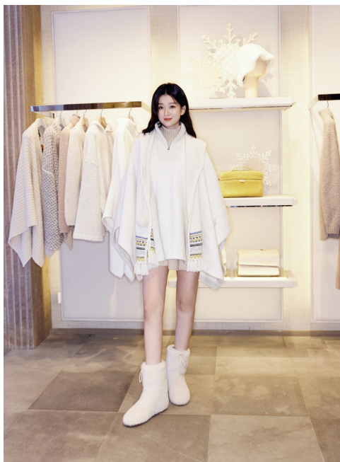
義大利奢侈品牌 Loro Piana 特邀演員喬欣優雅出席