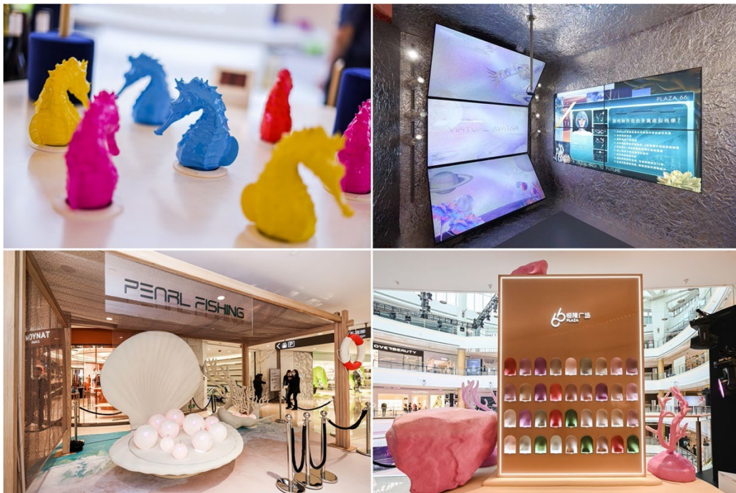
現場打造未來夢幻風格的玩趣互動裝置，讓賓客收穫驚喜禮遇

本次「HOME TO LUXURY」盛裝派對以「寰宇未來」為靈感與主題，帶領賓客開啟了一場沉浸式未來旅途，徜徉於綺幻宇宙。派對現場別出心裁地打造了眾多陳列於各樓層的趣味互動裝置，為到場賓客增添豐富的玩樂體驗：參與奇趣打海馬，贏取驚喜好禮；在虛擬照相機內，生成專屬的未來照片 ID；在夢幻珍珠機處，釣起珍珠贏取抽獎機會；更有幸運大轉盤與歡樂盲盒機，為賓客帶來無限趣味驚喜。