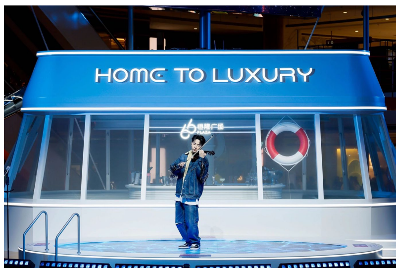
全能音樂人 HENRY 劉憲華閃耀登場，魅力全開

作為備受矚目的頂尖時尚盛事，「HOME TO LUXURY」每年都持續為賓客創造驚喜，突破無窮想像，帶來獨一無二的絕妙享受。18日派對當天，「太空飛船」降落商場中庭，美侖美奐的開場演繹與奇巧精妙的太空漫步率先揭開盛宴序章。夜幕低垂，全能音樂人劉憲華一襲華裝閃耀登場，魅力全開，點亮全場；先鋒唱作人及演員王子異在充滿科幻色彩的未來之艦上光臨亮相，帶領賓客一起玩轉寰宇之旅。