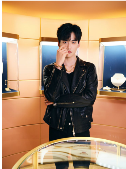
義大利珠寶品牌 Pomellato 特邀國際男子唱演組合 INTO1 成員周柯宇出席