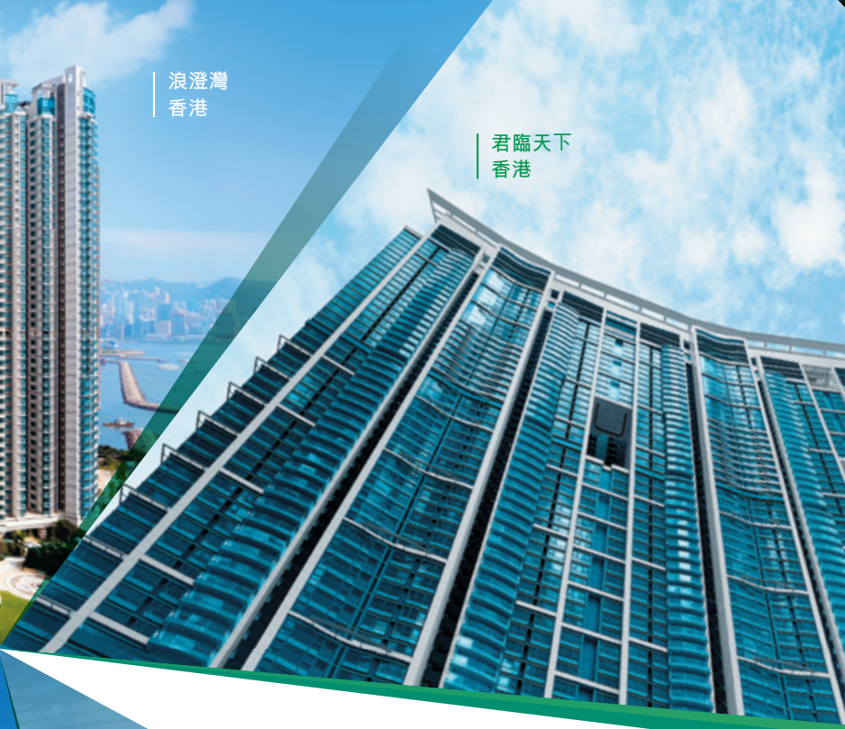
| 君臨天下 香港