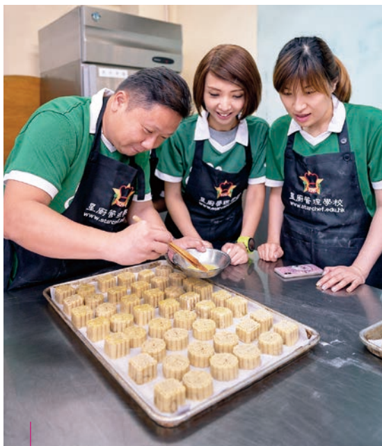
我們舉辦不同的活動，包括工作坊、瑜伽班和聖誕家庭同樂日，向員工推廣工作與生活平衡和身心健康