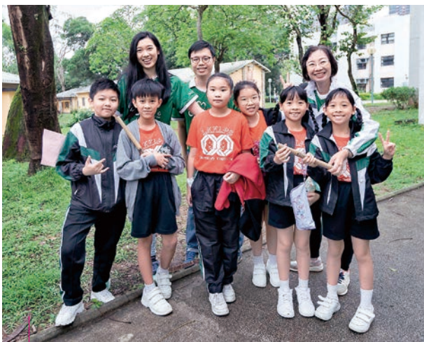
恒隆在香港和內地舉行一系列以環境保護為主題的義工活動，宣揚綠色生活

香港方面，我們與活現香港、基督教香港信義會及沙田多元化金齡服務中心三個機構攜手合作，為長者舉辦電車導賞團。我們的義工隊亦化身導賞員，帶領葵青區的基層兒童參觀灣仔藍屋和參與藍染工作坊，更為一群小學生舉辦「竹子升級再造」環保營，加深他們對「升級再造」環保概念的認識。