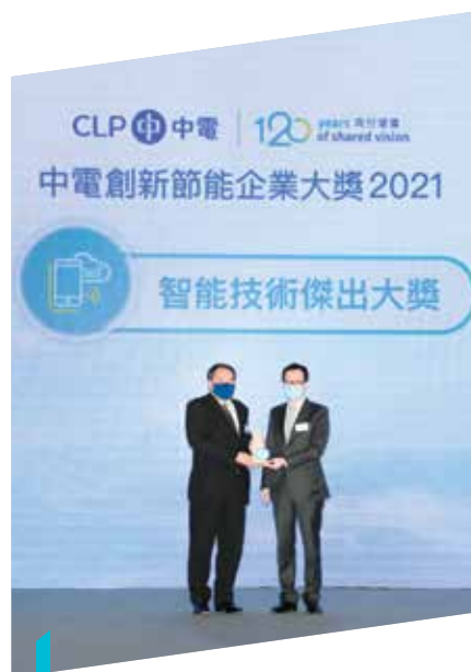
淘大商場於「創新節能企業大獎」獲頒「智能技術傑出大獎」，表揚其於節能方面的傑出表現

我們已詳細審視內地和香港物業組合的耗水量和實際用水，並實地考察上海港匯恒隆廣場和在港島東的物業（包括康怡廣場、康蘭居及康怡花園俱樂部）現行的水務營運和節水措施。我們總括出加強