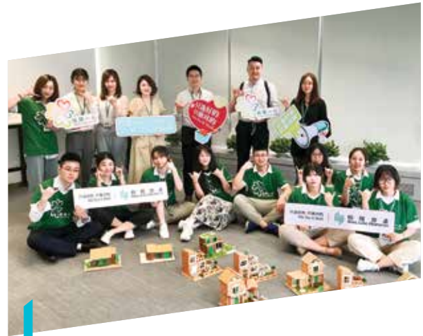
我們舉辦全國性暑期實習生計劃，為年輕人提供工作機會，讓他們於不同部門工作

本公司為內地和香港來自不同背景的人士製造機會。我們於2021年推出全國性暑期實習生計劃，為72名學生（包括兩名有特殊需要的學生）於不同部門及項目提供工作機會。為鼓勵年輕人投身社區服務，我們亦招募實習生參與及舉辦社會服務計劃，包括肥皂回收再造和電池棄置活動。恒隆深明我們有能力為殘疾人士付出更多，並計劃於2025年前審核旗下所有物業及企業實務，在硬件和軟件兩方面雙管齊下，提供更多共融機會。