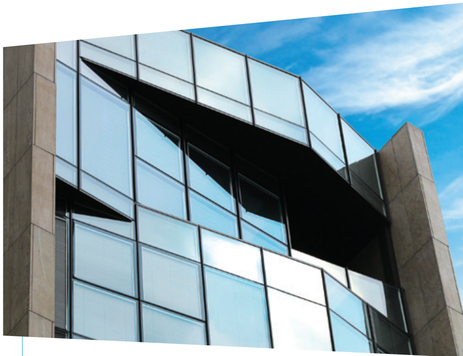
藍塘道23-39已於二零一四年取得入伙紙