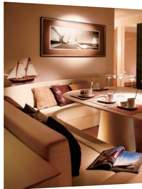
浪澄灣是位於西南九龍黃金地段的高尚住宅

集團於優越地段建造高質素的住宅物業，並採取嚴格的銷售方式，務求將物業價值最大化，因而於市場上一直廣受歡迎。