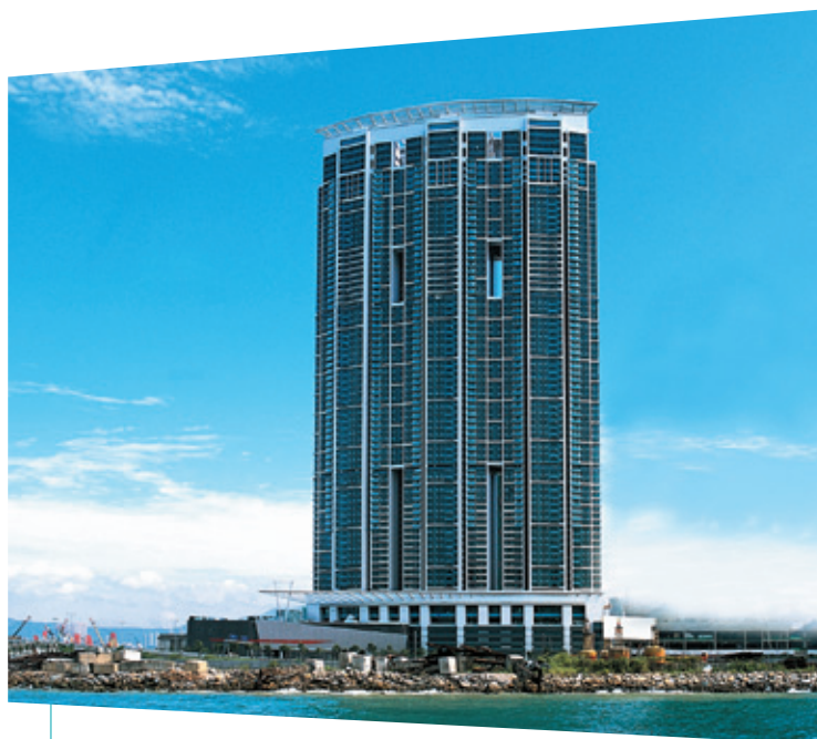
君臨天下盡享遼闊瑰麗的香港維多利亞港美景