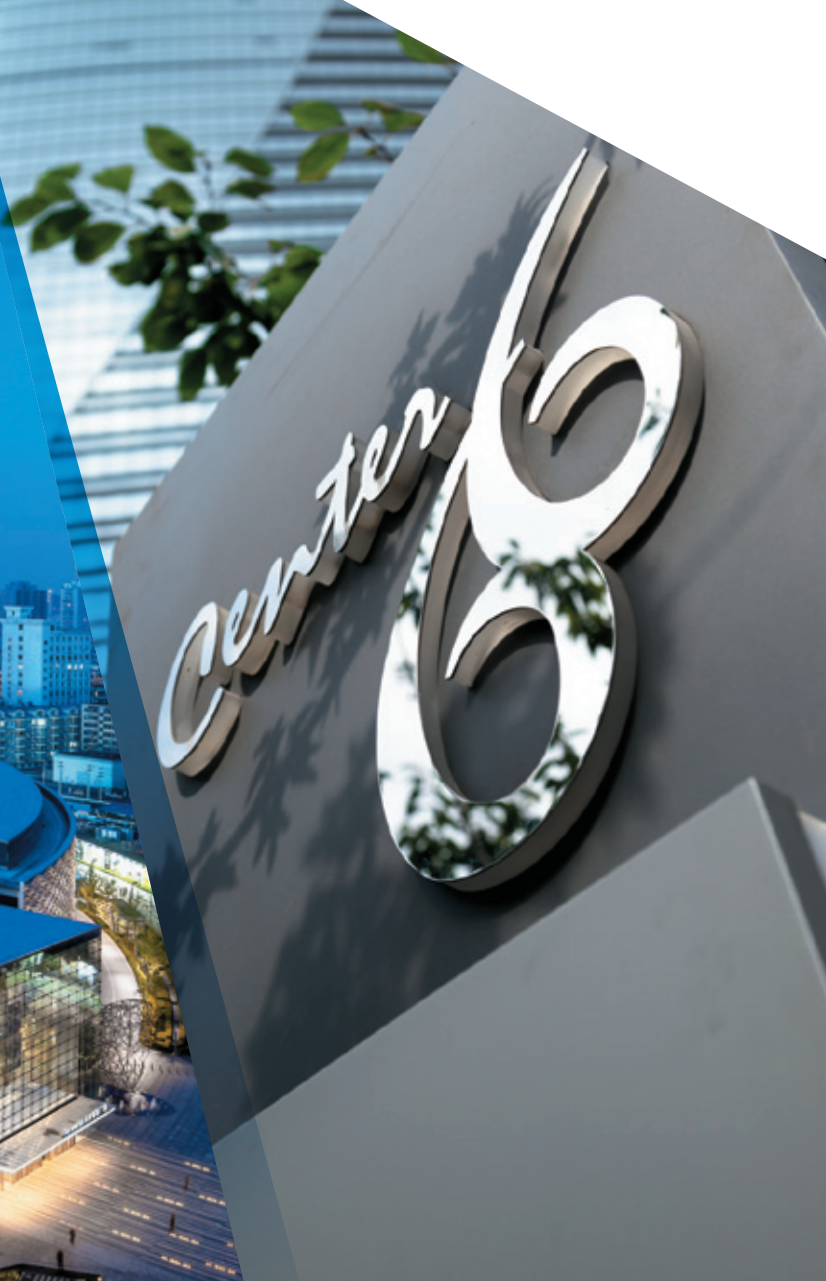
市府恒隆廣場 • 瀋陽