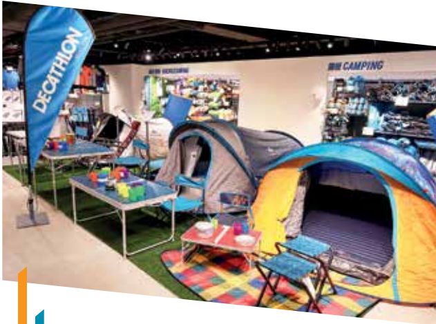
旺角物業組合引入多家運動用品專門店，以迎合本地顧客對戶外活動用品與日俱增的需求