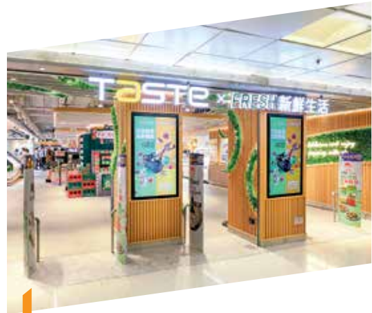
淘大商場持續優化租戶組合以提升顧客體驗，當中包括引入聯乘概念超級市場「TASTE x FRESH 新鮮生活」進駐