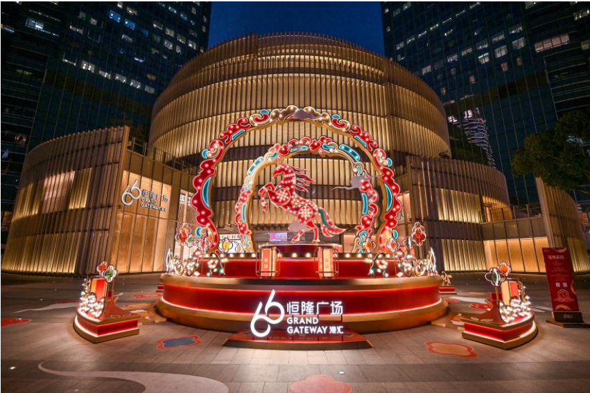
八城十座恒隆广场联动呈现的新春活动开启恒隆 66 周年庆典序章