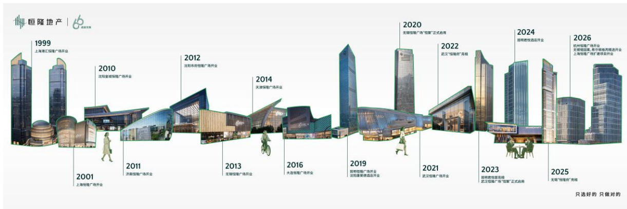
“66” 品牌的主要里程碑