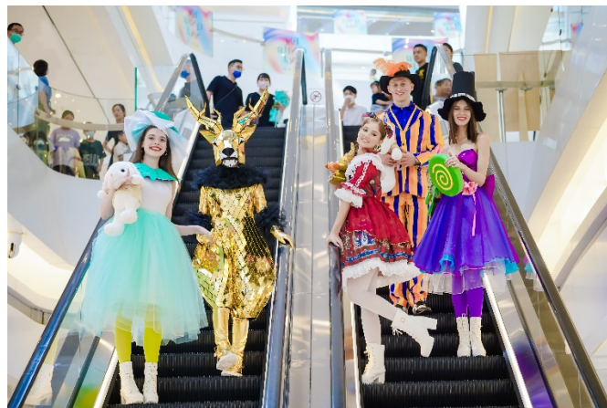
無錫恒隆廣場「TAKE CENTER STAGE」