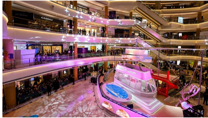
上海恒隆廣場「HOME TO LUXURY」盛裝派對

HEARTLAND」、瀋陽市府恒隆廣場 11 周年慶的盛裝派對，尊貴會員得以受邀到訪不同城市，感受多樣城市風情和獨特魅力。