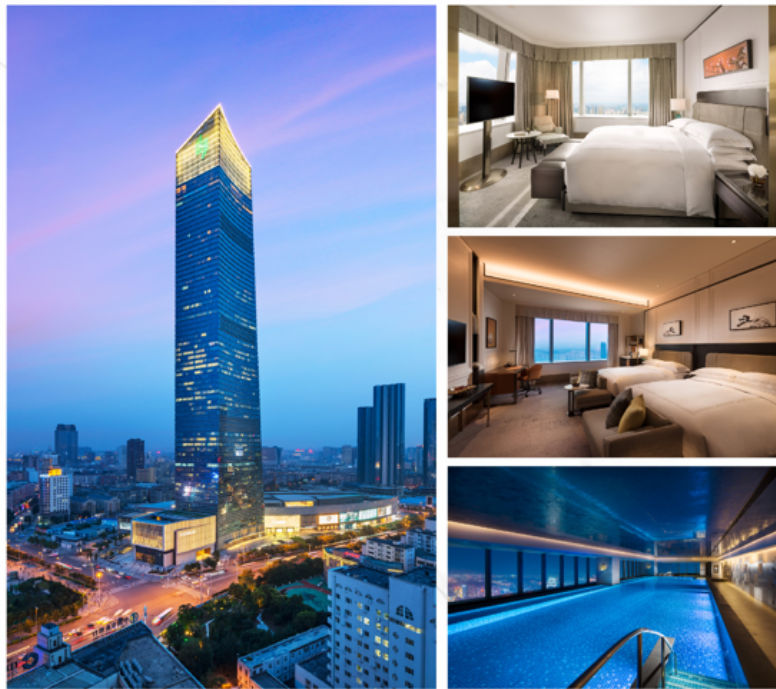
瀋陽康萊德酒店尊享優惠

秉承恒隆「只選好的 只做對的」理念，「恒隆會」始終致力於為顧客創造價值，並透過締造獨特尊尚的個人化體驗，滿足高消費客戶。藉此煥新之際，「恒隆會」強化會員福利，隆重推出星級聯盟夥伴禮遇，與全國性跨界夥伴緊密合作，不論身在全國何處，透過「恒隆會」會員尊屬身份皆可盡享美酒佳餚、酒店旅遊（例如瀋陽康萊德酒店）、信用卡回贈，以及文化藝術等不同行業平台的尊尚禮遇，在購物之外為每一位會員提供細緻而周到的安排，全方位滿足會員的生活品味。