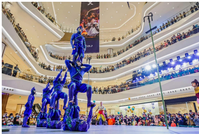
武漢恒隆廣場「BE MY HEARTLAND」