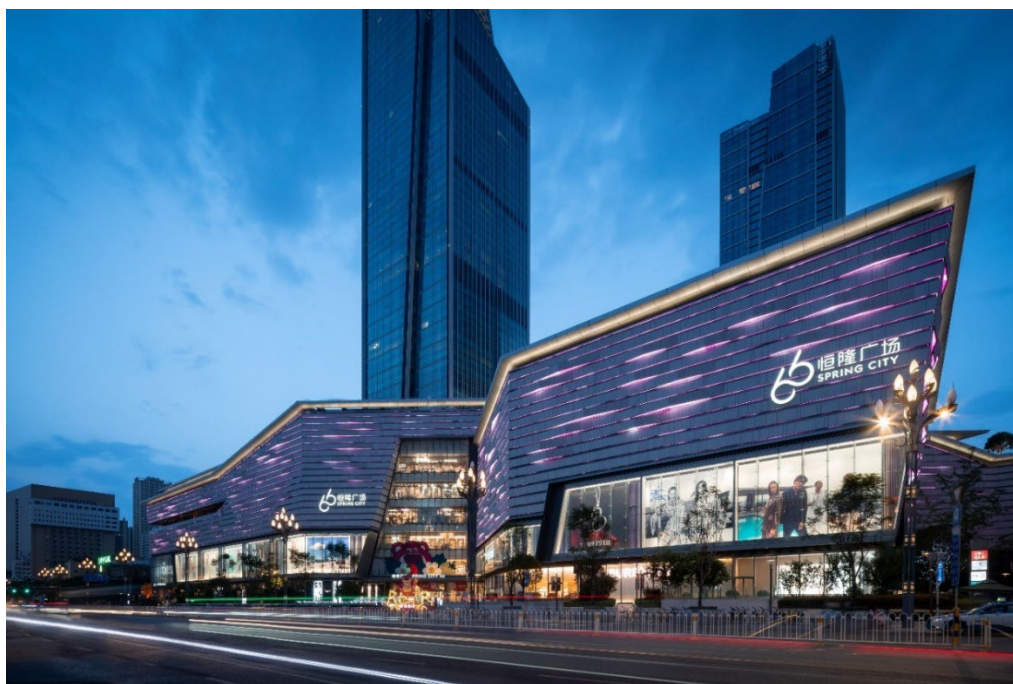
昆明恒隆广场以“带昆明看世界，让世界看昆明”为理念， 是恒隆在中国西南部首个项目