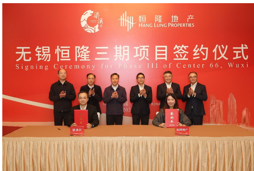
無錫恒隆三期擴展項目簽約儀式