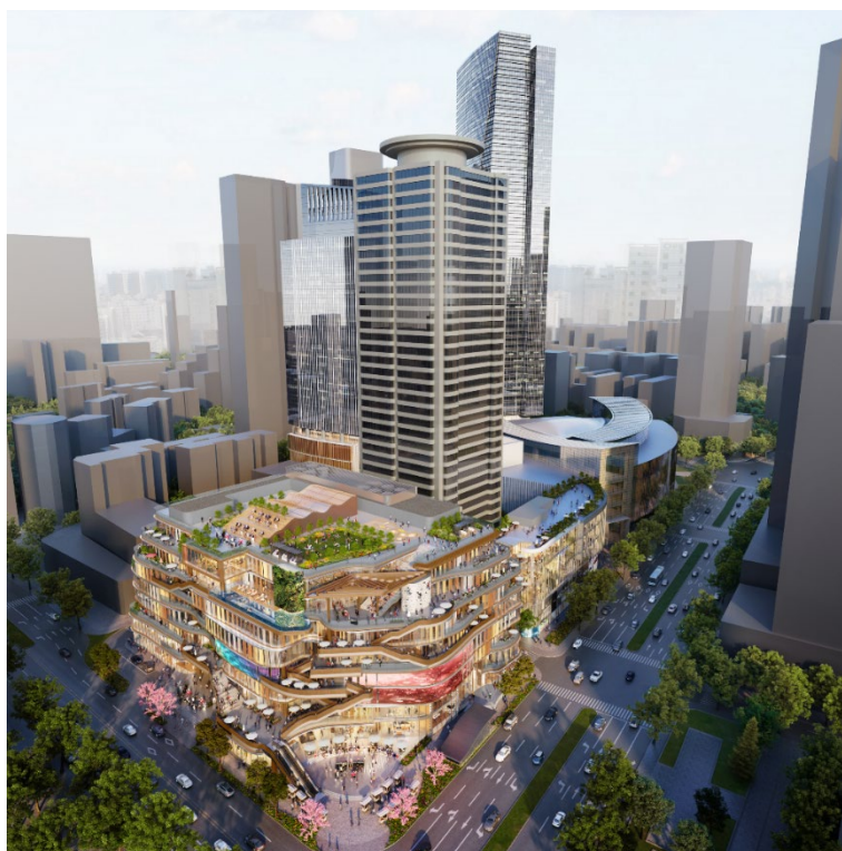
無錫恒隆廣場擴展項目效果圖