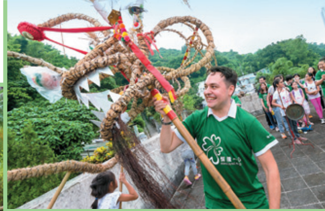
義工帶領小學生認識饒富特色的傳統藝術