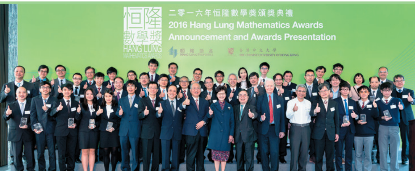
恒隆與香港中文大學數學科學研究所及數學系 合辦兩年一度的盛事——恒隆數學獎

我們樂於與社會服務機構合作，致力全面回饋社會。我們捐款港幣200萬元予香港紅十字會，為其新建總部設立多用途活動室，並舉辦「恒隆捐血日」，鼓勵員工及租戶捐血救人，貢獻社會。