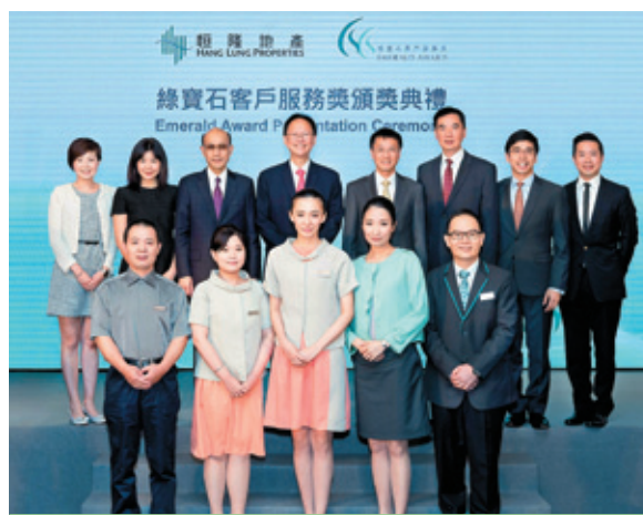
恒隆設立「綠寶石客戶服務獎」，讚揚在客戶服務方面表現出色的前線員工

在香港，義工隊除了延續「建築導賞團」和「孖住長者當文青」系列外，更推出嶄新的「也文也武 文化傳承」系列，帶領一班來自低收入家庭的小學生認識饒富特色的傳統藝術，如活字印刷、竹棚建築、舞火龍及粵劇。去年，我們為超過200位中學生舉辦「建築導賞團」，啟發他們對本土歷史及文化的熱誠。活動更於由社會福利署推廣義工服務督導委員會舉辦的「2014-16最佳企業義工計劃比賽」中勇奪季軍，證明義工隊能夠充分運用知識，為社會出一分力。