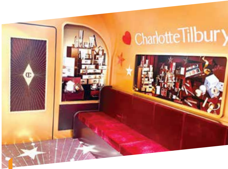
銅鑼灣 Fashion Walk 以限定店及 大型品牌概念店來保持商場的新鮮感