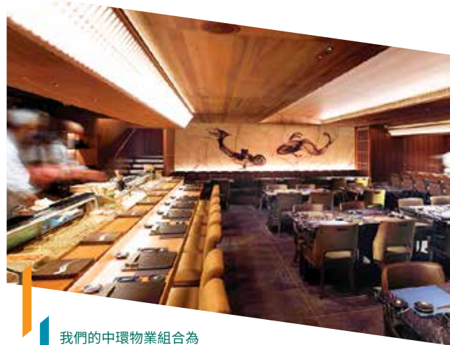
我們的中環物業組合為 顧客精挑細選多家優質 及獨特的餐廳

未來，Fashion Walk 將致力加強租戶組合，重點引入國際時裝、美容及潮流街頭時裝品牌。至於鄰近的恒隆中心，雖然時裝批發和旅行社等主要租戶業務受疫情重創，但2021年的租出率仍然維持穩定。我們會繼續吸納更多來自醫療、美容及時尚生活等對經濟狀況變更有較強韌表現的行業為租戶。