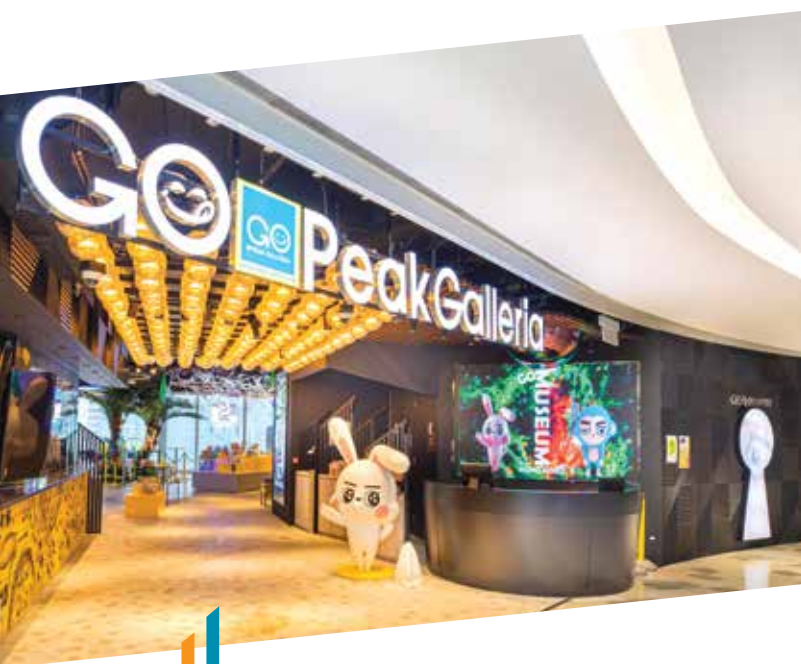
香港首創的體驗式商店 GO@PEAK GALLERIA 為山頂廣場注入吸引本地顧客的元素