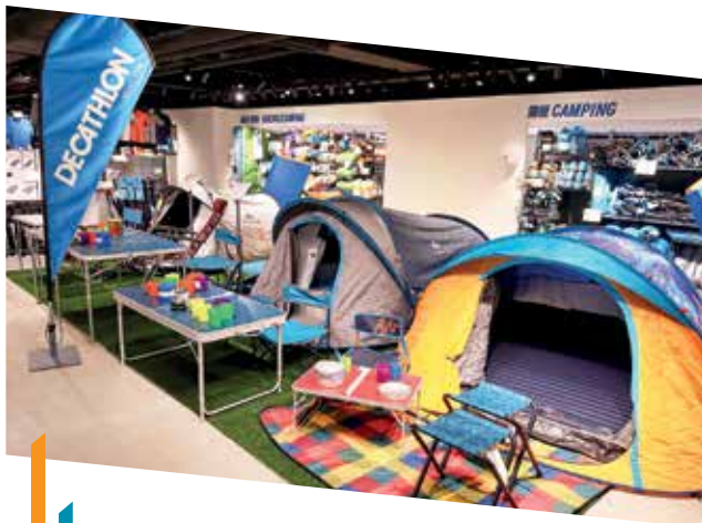
旺角物業組合引入多家運動用品專門店，以迎合本地顧客對戶外活動用品與日俱增的需求