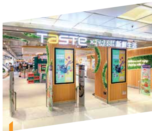
淘大商場持續優化租戶組合以提升顧客體驗，當中包括引入聯乘概念超級市場「TASTE x FRESH 新鮮生活」進駐