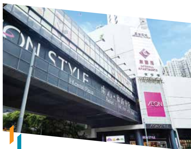
康怡廣場持續優化租戶組合，保持了其對附近居民及上班族的新鮮感

鑒於訪港旅客人數持續低迷，山頂廣場在準備迎接旅客回歸的同時，亦會繼續專注打造獨一無二的城中熱點，並引入更多時尚生活及體驗式品牌，包括生活時尚及健康用品店等。