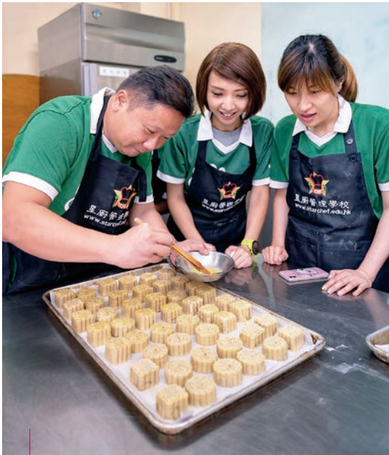
我們舉辦不同的活動，包括工作坊、瑜伽班和聖誕家庭同樂日，向員工推廣工作與生活平衡和身心健康