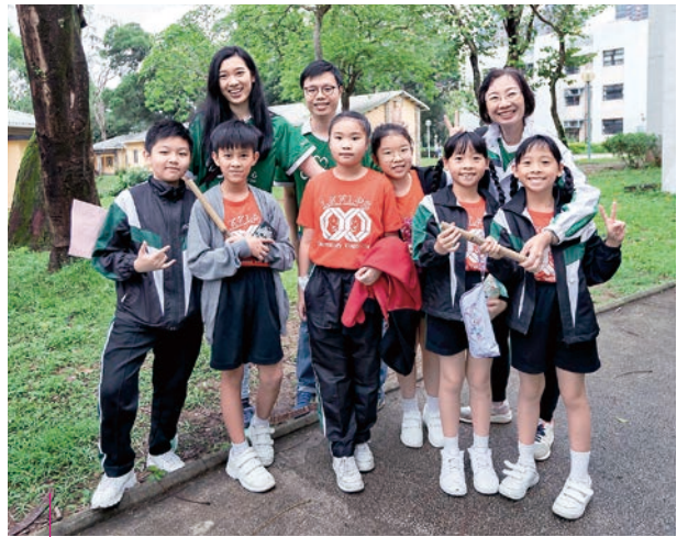
恒隆在香港和內地舉行一系列以環境保護為主題的義工活動，宣揚綠色生活

香港方面，我們與活現香港、基督教香港信義會及沙田多元化金齡服務中心三個機構攜手合作，為長者舉辦電車導賞團。我們的義工隊亦化身導賞員，帶領葵青區的基層兒童參觀灣仔藍屋和參與藍染工作坊，更為一群小學生舉辦「竹子升級再造」環保營，加深他們對「升級再造」環保概念的認識。