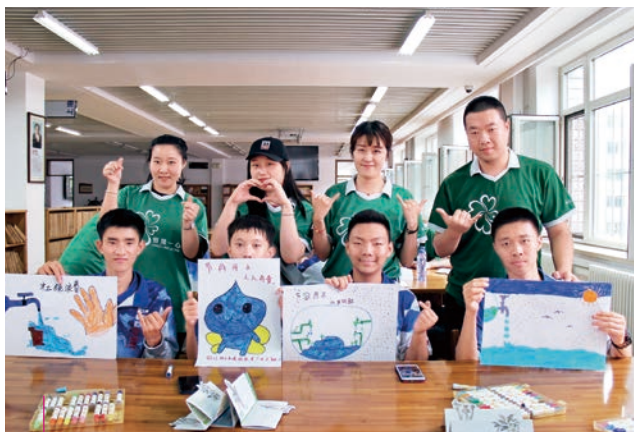
我們和社區夥伴合辦有意義的活動，與員工一起支援社區上有需要人士

與社區齊肩並進是我們可持續發展策略的重要元素，而「恒隆一心」義工隊更是其中不可或缺的一環。2019年，我們的義工活動繼續聚焦三大範疇：青少年發展、長者服務及環境保護。我們於年內在內地舉辦了104項義工活動，義工服務時數超過13,500小時。