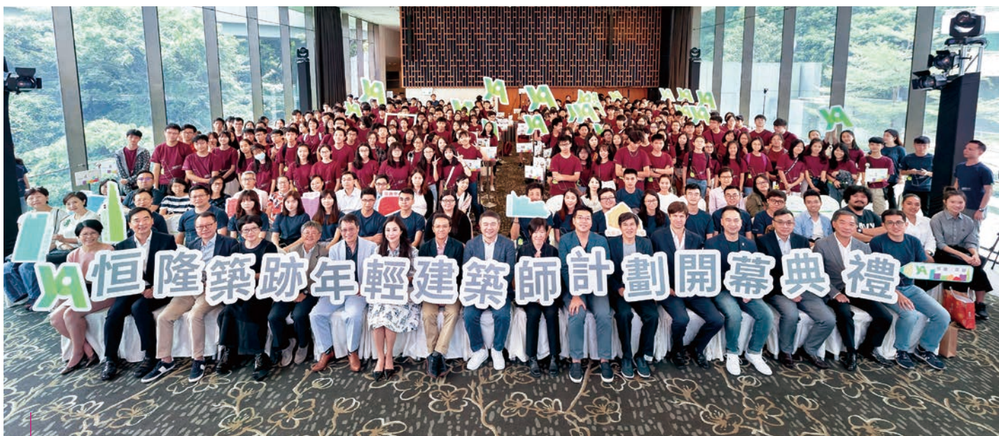
「恒隆·築跡 —— 年輕建築師計劃2019-20」獲得15位來自建築界及學界的領袖擔任計劃顧問

我們的可持續發展表現及披露實務的透明度獲本地及國際認可。我們在過去十年是恒生可持續發展企業指數以及恒生（內地及香港）可持續發展企業指數的成份股，並一貫保持「AA」評級。在國際領域上，我們亦連續三年獲納入為道瓊斯可持續發展亞太指數的成份股，同時在全球房地產可持續發展基準維持「三星」表現評級及資料披露「A」評級。該等嘉許乃根據公開披露資料、所採取的政策及選定領域績效作出客觀評估，表揚在可持續發展方面表現卓越的公司。