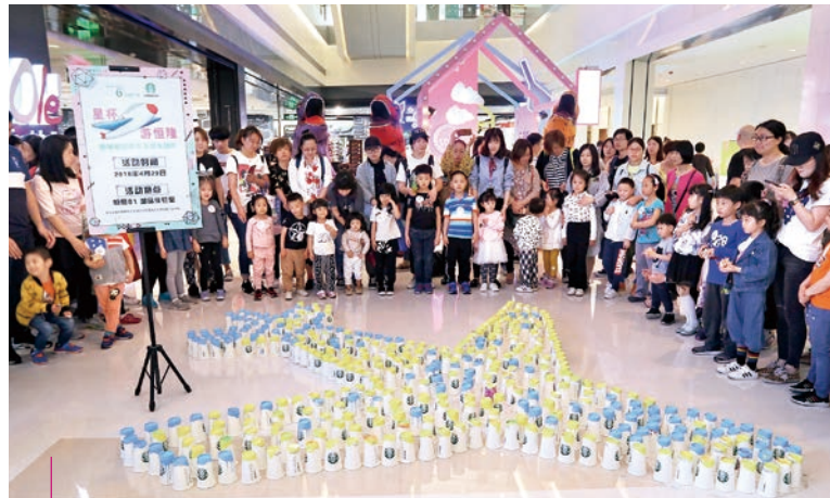
我們的購物商場與租戶合作舉辦活動，向市民推廣綠色環保和低碳生活的訊息

為了應對氣候變化可能對業務造成的實際損害，2019年我們初步在企業層面開展氣候風險查找工作。我們亦會監察碳排放量，並聘請獨立顧問核實年度範圍一及範圍二的溫室氣體排放數據。