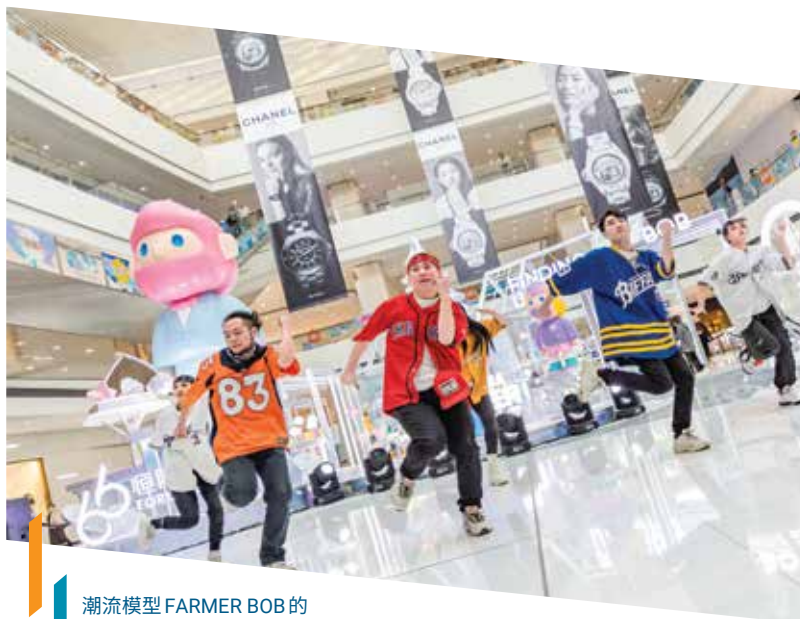
潮流模型FARMER BOB的裝置為瀋陽市府恒隆廣場增添動力