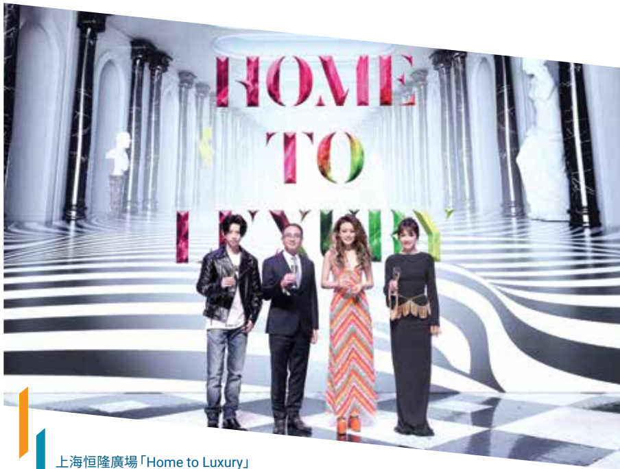
上海恒隆廣場「Home to Luxury」 盛裝派對以限量的時尚商品、名人表演 及互動裝置，成功提升租戶銷售額，並獲得顧客支持