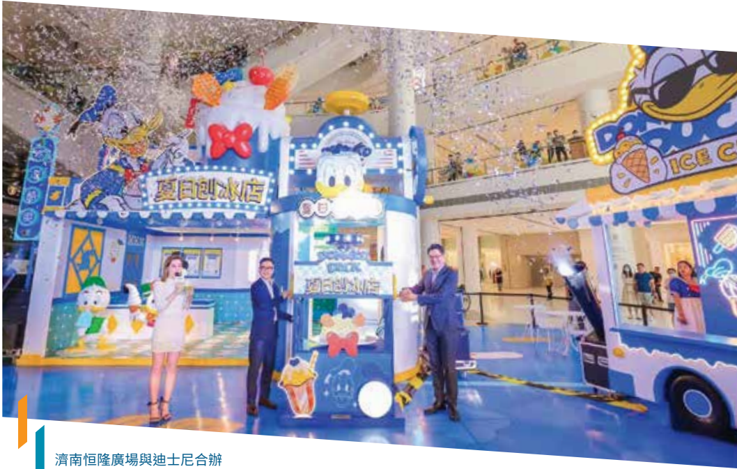
濟南恒隆廣場與迪士尼合辦 推廣活動，為顧客提供線上及 實體的互動體驗