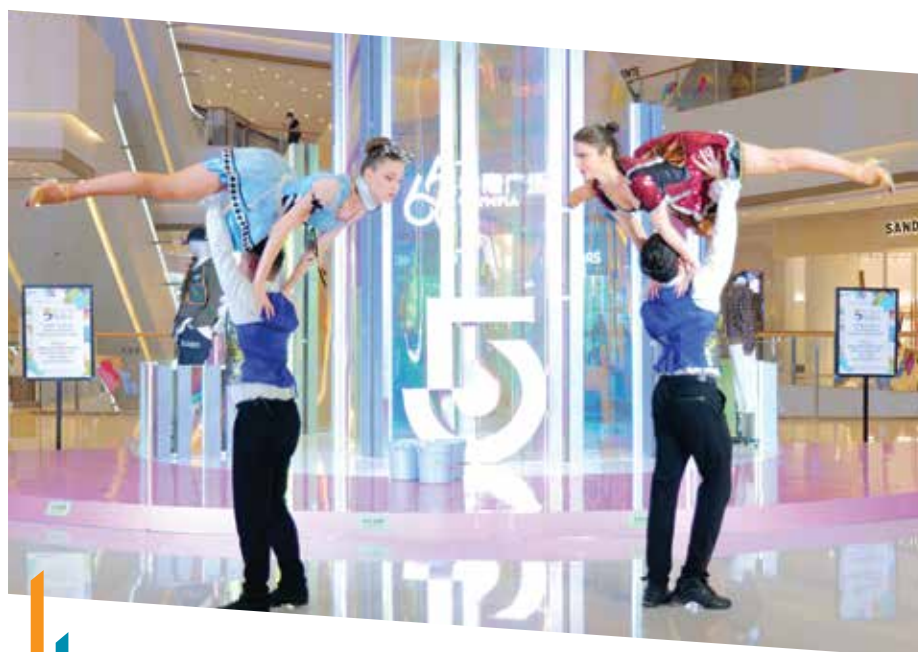
大連恒隆廣場舉辦五周年誌慶活動， 與逾150個租戶聯手推出互動節目、推廣優惠及抽獎