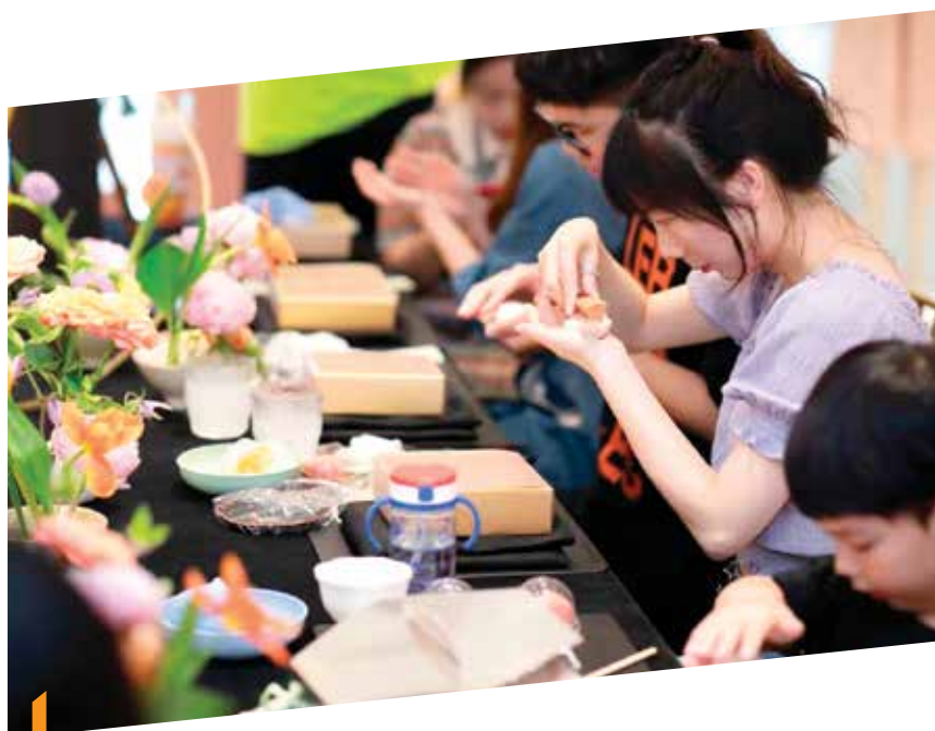
無錫恒隆廣場為「恒隆會」會員舉辦專屬工作坊，藉此增強與顧客的連繫

商場於2022年的前景大致向好，預期租戶銷售額有所增長。除了推動有機增長外，無錫恒隆廣場亦會透過吸納策略性品牌和優化現有租戶，繼續調整其租戶組合，並提升顧客體驗。