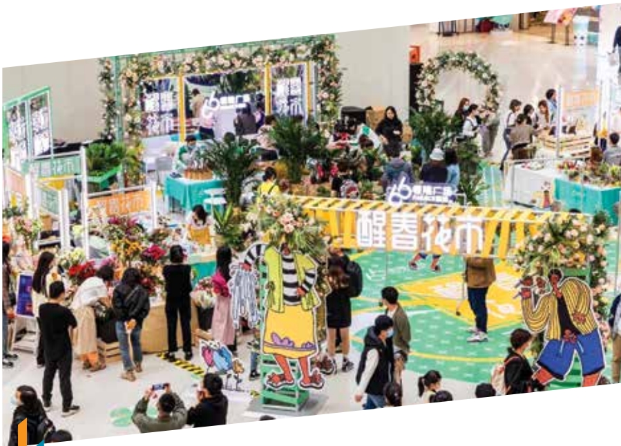
瀋陽皇城恒隆廣場舉辦花市等 限定活動以刺激客流

踏入2022年，商場將專注透過引入更多元化和流行食肆，以強化餐飲選擇，同時，亦致力吸引更多高級服裝飾品品牌落戶。