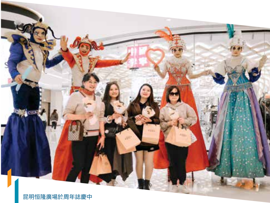
昆明恒隆廣場於周年誌慶中 安排了快閃娛樂表演，為顧客 帶來沉浸式購物體驗