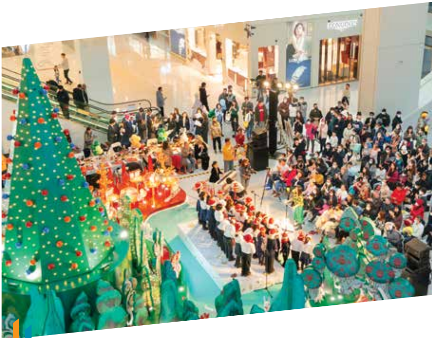
天津恒隆廣場於其聖誕活動「奇幻『森』誕，暖冬永『恒』」中安排現場表演，增添節日氣氛

2022年，商場將致力改善租戶組合以提供更多品牌選擇，當中尤以高級女士時裝及珠寶為重點。