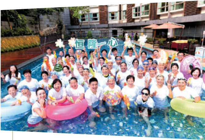
「恒隆一心義工隊」與三十位長者舉行泳池派對