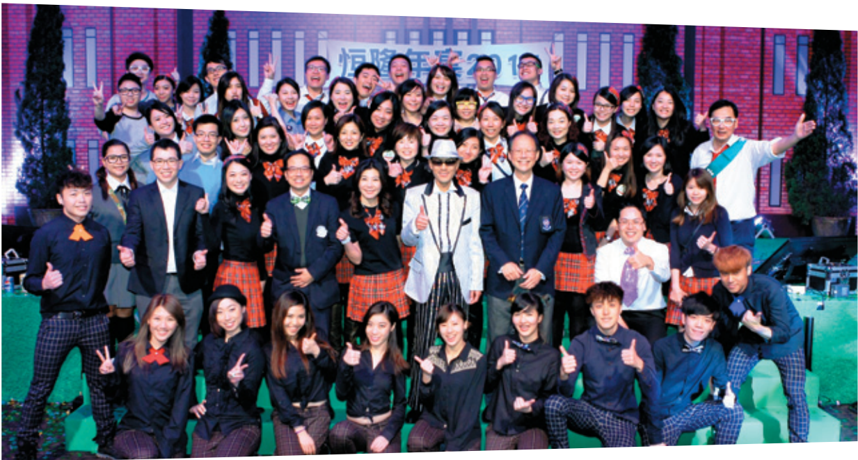
以「Let's Go Green」為主題的二零一四年恒隆年宵