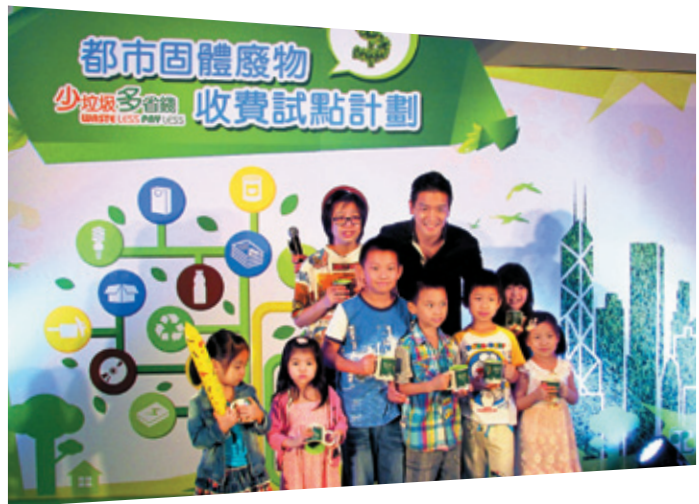
淘大花園管理處增設回收設施及舉辦多項活動，鼓勵住戶參與 「都市固體廢物收費試點計劃」