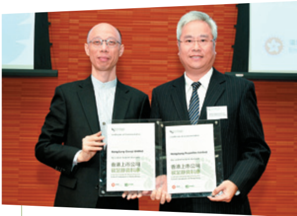
恒隆是首批在「香港上市公司碳足跡資料庫」上公開 碳排放數據的六十四間上市公司之一

我們投入大量資源，於旗下物業安裝環保設施。二零一四年九月於天津開幕的恒隆廣場，乃我們綠色發展項目的新典範。我們精心挑選建築物的外牆物料，在炎夏和寒冬均能達至最佳的隔熱和保暖效能，並安裝了熱回收系統，提升能源效益。我們亦採用節能的照明系統和制冷機組，進一步提升建築物的能源效益。此外，回收再造的廢物在數量和種類上均非常可觀，這些數據反映了公司規定中國內地所有新項目均以取得美國綠色建築協會的「能源及環境設計先鋒獎」的金級認證為目標，並在建築物的設計中融入環保因素等政策已見成效。天津的恒隆廣場已於二零一五年獲頒「能源及環境設計先鋒獎——核心及外殼組別」金獎認證，而我們於內地的第十個項目——武漢的恒隆廣場，亦已於二零一四年獲得金獎預認證。