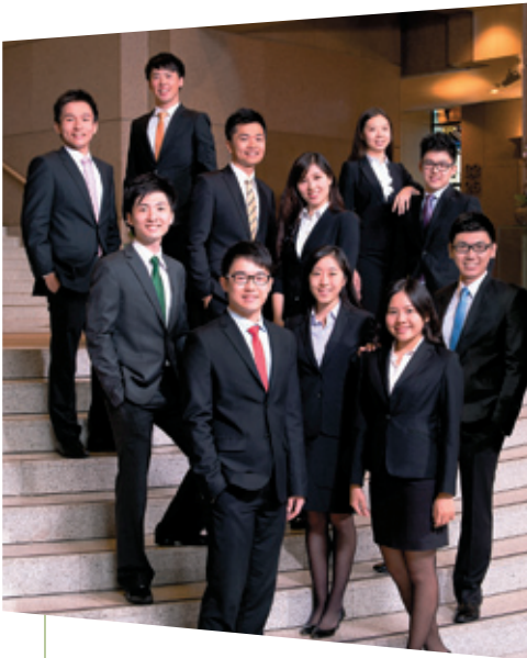
恒隆管理培訓生計劃 吸引大批來自香港、 內地及海外的大學 畢業生申請