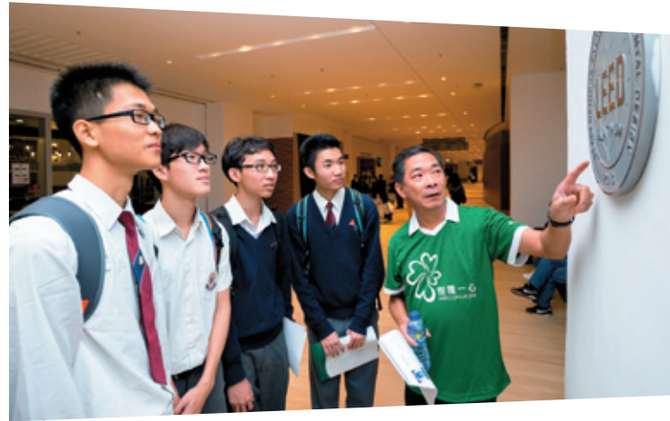
「建築導賞團」帶領超過七十位中學生實地考察香港的獨特建築