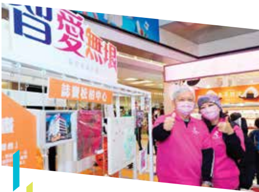
「恒隆 x 女青『智愛無垠』 認知友善計劃」旨在建設關愛 認知障礙症患者的共融社區