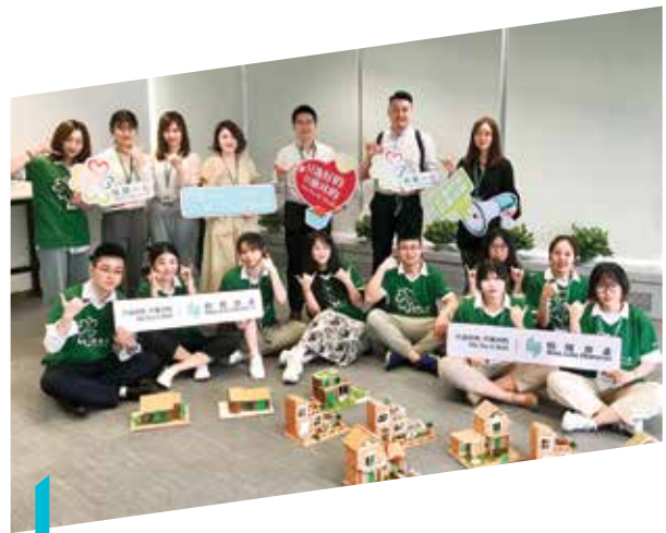
我們舉辦全國性暑期實習生計劃，為年輕人提供工作機會，讓他們於不同部門工作

本公司為內地和香港來自不同背景的人士製造機會。我們於2021年推出全國性暑期實習生計劃，為72名學生（包括兩名有特殊需要的學生）於不同部門及項目提供工作機會。為鼓勵年輕人投身社區服務，我們亦招募實習生參與及舉辦社會服務計劃，包括肥皂回收再造和電池棄置活動。恒隆深明我們有能力為殘疾人士付出更多，並計劃於2025年前審核旗下所有物業及企業實務，在硬件和軟件兩方面雙管齊下，提供更多共融機會。