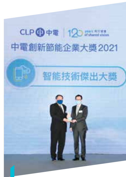
淘大商場於「創新節能企業大獎」獲頒「智能技術傑出大獎」，表揚其於節能方面的傑出表現

我們已詳細審視內地和香港物業組合的耗水量和實際用水，並實地考察上海港匯恒隆廣場和在港島東的物業（包括康怡廣場、康蘭居及康怡花園俱樂部）現行的水務營運和節水措施。我們總括出加強