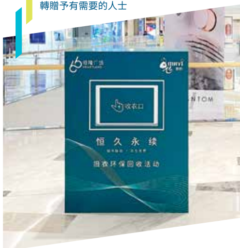
武漢恒隆廣場與非政府機構飛螞蟻及「恒隆一心義工隊」合辦舊衣募集及分類活動，將顧客捐贈的舊衣物轉贈予有需要的人士

我們繼續地致力透過一系列措施和計劃，改善員工福祉和參與度。本公司定期與市場基準作比較，提供具競爭力的薪酬及福利待遇。2021年，我們的關鍵人才留任率高達92.6%，約53%關鍵員工於年內獲晉升或擴闊視野的機會。