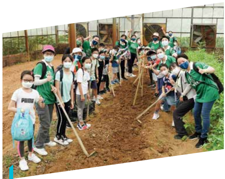
980名內地及香港的企業義工一同參與 全國性周年義工日，宣揚低碳生活