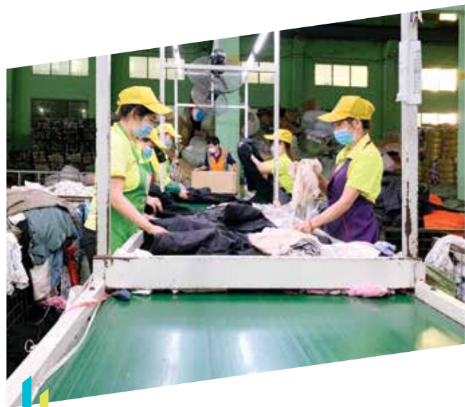
我們與一家回收公司合作，於內地收集了近24噸舊前線員工制服作升級再造或循環再用